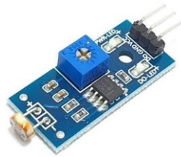
Gambar 3 Sensor Cahaya LDR