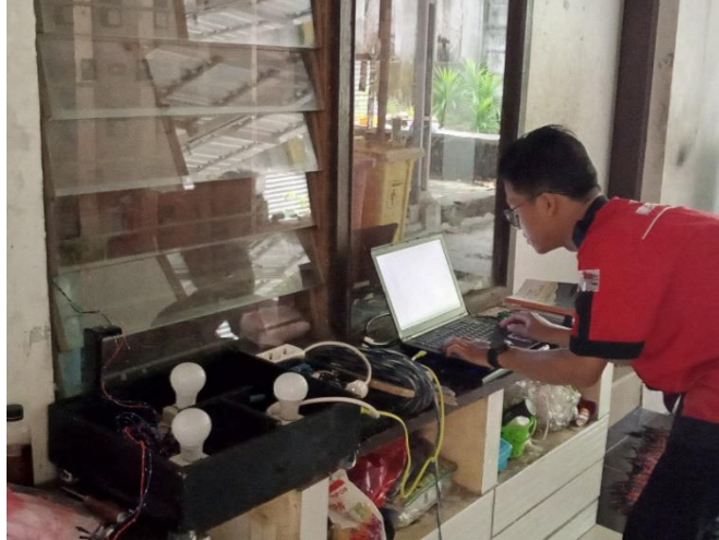
Gambar 4 Pengujian tampilan sensor Light dependent resistor di serial monitor dan aplikasi

Gambar 4 merupakan pemasangan sensor Light dependet resistor (LDR) yang di letakkan di salah satu sudut masjid dengan ketinggian 2 meter dari karpet kemudian di monitoring melalui laptop dengan jarak antara laptop dan sensor mencapai 5 meter. Yang akan di perjelas pada gambar 5.