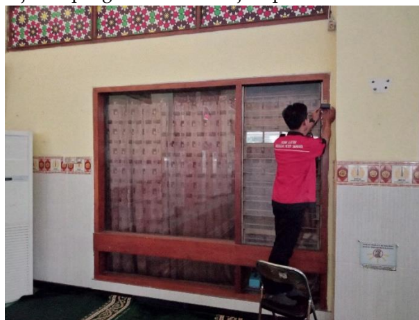
Gambar 4 Pemasangan Sensor LDR

Pada pengujian ini sensor LDR di pasang di salah satu sudut di dalam ruang utama yang kemudian di monitoring melalui smartphone dan laptop, pada pengujian ini dilakukan sebanyak 10 kali pengamabilan data dengan jarak pengambilan data 1 jam per data.